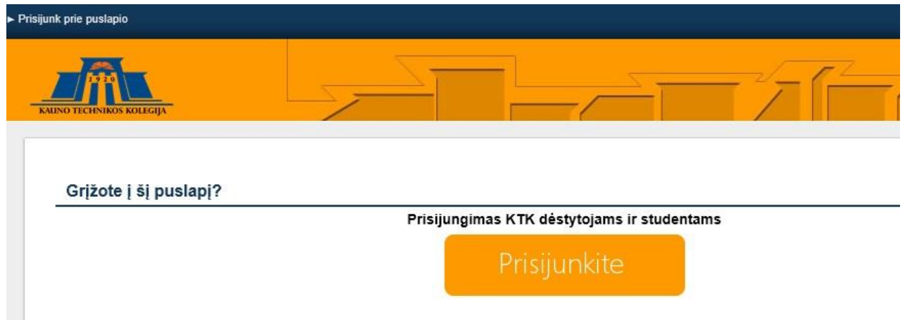
1.2 pav. Prisijungimas prie svetainės (2)

Prisijungę prie svetainės galite surasti ir prisijungti prie paskaitų medžiagos.