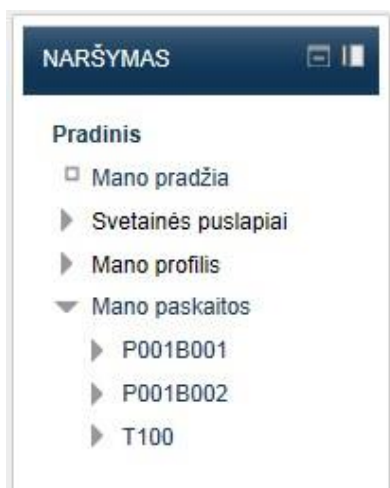
1.5 pav. Naršymo blokas matomas studentams

Kurso aplinkoje matysite naršymo bloką, kuriame rasite meniu punktus: „Mano pradžia“, „Svetainės puslapiai“, „Mano profilis“, „Mano paskaitos“. Čia rasite įvairią personalizuotą informaciją.